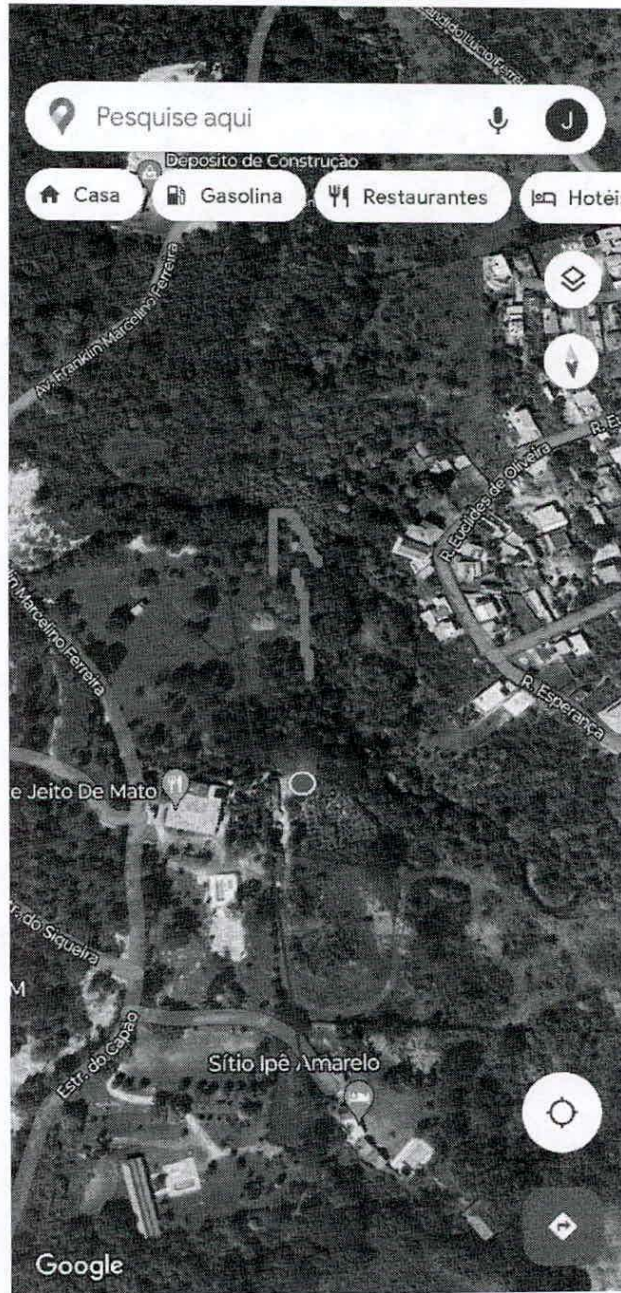
Figura 10. Novo traçado proposto, passando a cerca de 50 Metros do Restaurante Jeito do Mato. A seta em vermelho, é sentido BR 381.