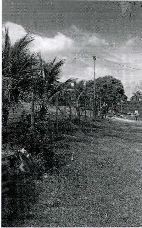
Figura 05. Foto in loco do atual traçado do mapa da figura 04, no sentido BR 381.