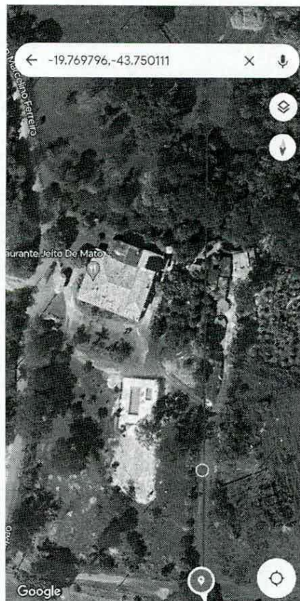
Figura 04. Traçado atual do Rodoanel, passando muito próximo do Restaurante Jeito de Mato. Sentido do restaurante, é sentido BR 381.