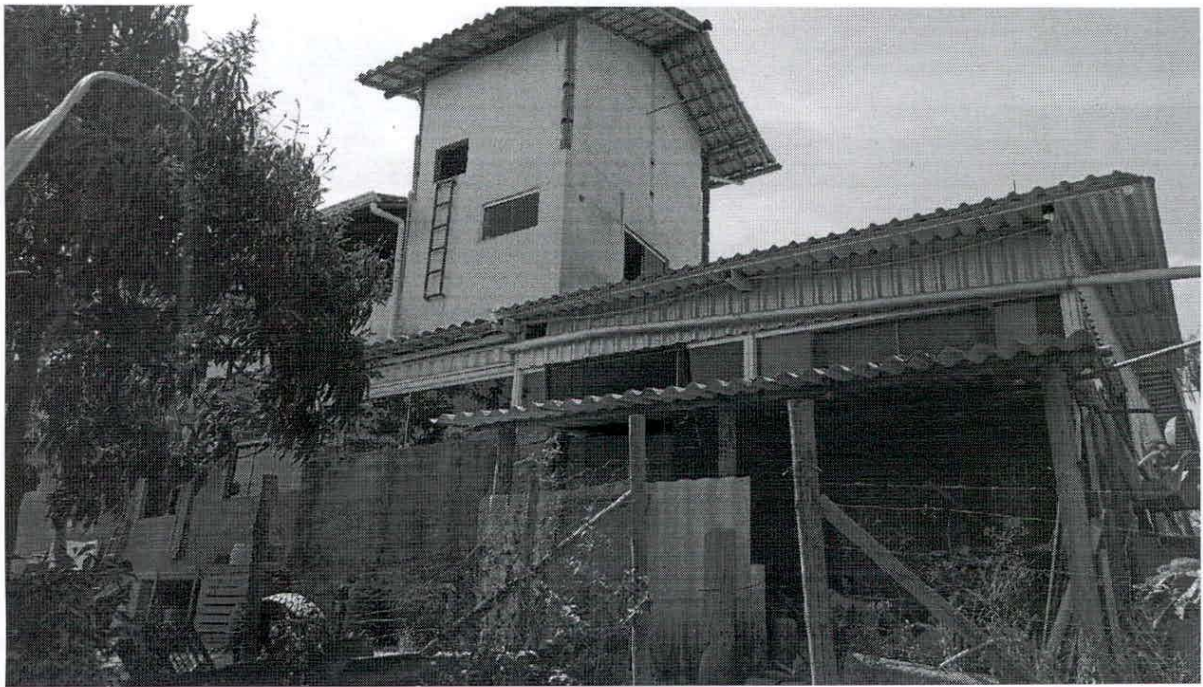
Figura 08. Imagem da parte de trás do Restaurante Jeito de Mato