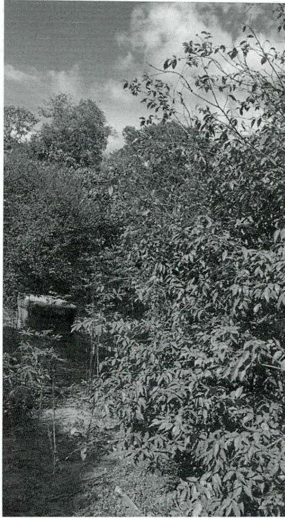
Figura 06. Foto in loco do atual traçado no terreno do Restaurante Jeito de Mato, no sentido BR 381.