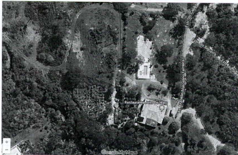
Figura 01. Traçado atual do Rodoanel no terreno do Restaurante Jeito de Mato