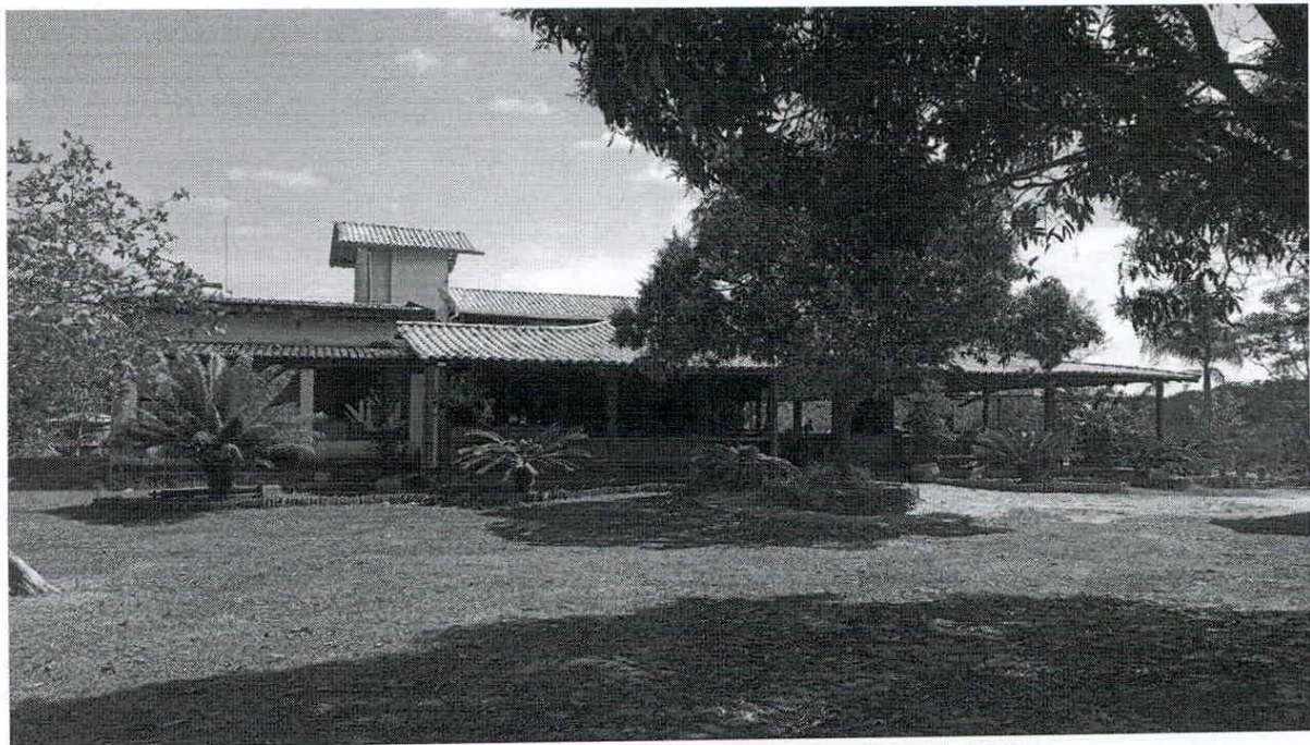
Figura 09. Imagem da frente do Restaurante Jeito de Mato