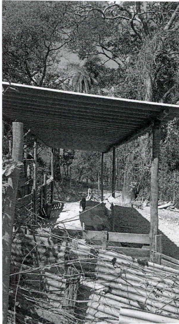
Figura 11. Foto in loco do novo traçado proposto, passando a cerca de 50 Metros do Restaurante Jeito do Mato, no sentido BR 381.