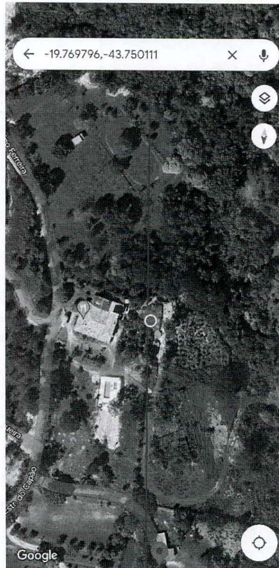
Figura 07. Traçado atual do Rodoanel. Observa-se a proximidade com o Restaurante Jeito de Mato