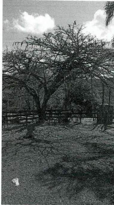
Figura 03. Foto in loco do atual traçado do mapa da figura 02, no sentido Santa Luzia